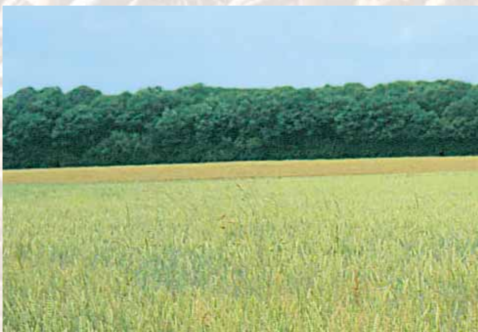
Parcelle de production de semences de céréale biologique

- Utiliser des semences de base indemnes de toute contamination. Pour cela, il est vivement conseillé aux établissements multiplicateurs de réaliser des analyses sanitaires avant la commercialisation des semences. Ces analyses doivent porter notam-