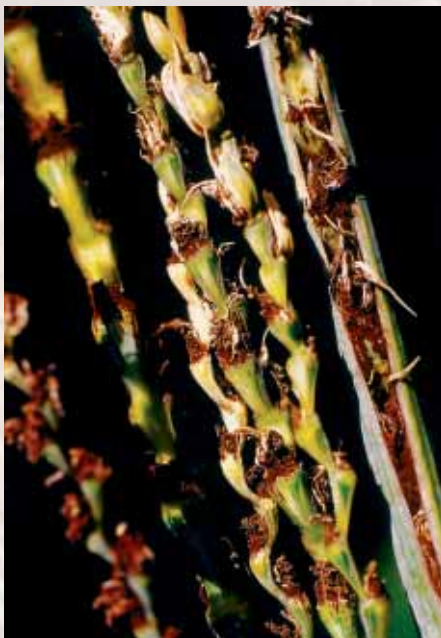
Charbon, carie sont des maladies en recrudescence dans le cadre des productions bio

Traitement en végétation : seul le soufre et le cuivre peuvent être appliqués en préventif. Actuellement, très peu de protections sont réalisées en cours de culture avec ces produits.