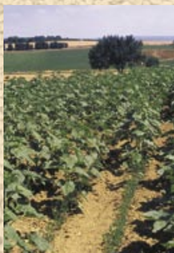
Implantation de luzerne sous couvert de tournesol