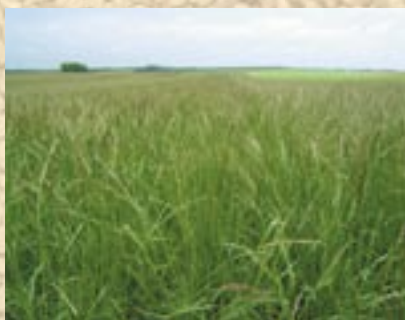
Parcelle de fétuque élevée porte-graine biologique en région Centre

Le principal handicap des productions de semences biologiques réside avant tout dans le niveau de productivité grainière (potentiel et régularité).