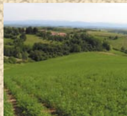
Parcelle de luzerne porte-graine biologique dans l'Ariège

Cette fiche présente un état des lieux des travaux engagés, des principaux résultats obtenus et des contacts utiles pour ces productions.