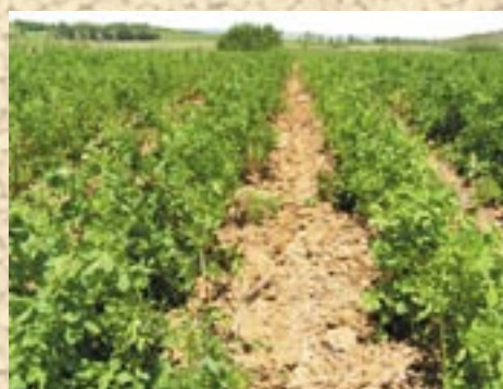
Lucernière sortie hiver désherbée mécaniquement