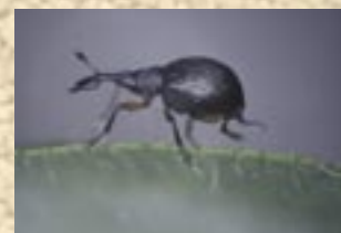
Apion trifolii adulte

Le principal frein à la production de cette légumineuse est l'apion ( Apion trifolii ). Ce petit coléoptère bleu métallisé a la particularité de pondre dans l'inflorescence du trèfle violet et sa larve se nourrit de graines contenues dans les capitules.